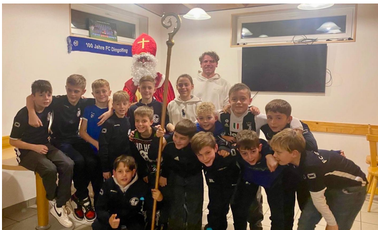
Harmonische Weihnachtsfeier: Die U11 des FC Dingolfing feierte einen gelungenen Jahresabschluss.

Die U11 blickt zufrieden auf das Jahr zurück und freut sich bereits auf die kommenden Herausforderungen im neuen Jahr.