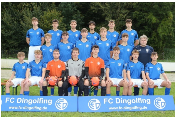
Die U17 des FC Dingolfing feiert nach einer beeindruckenden Hinrunde mit 72:6 Toren verdient die Herbstmeisterschaft

Mit dieser starken Ausgangsposition will die Mannschaft in der Rückrunde den ersten Tabellenplatz festigen. Neben dem sportlichen Erfolg steht weiterhin die Entwicklung jedes Einzelnen im Fokus. „Wir wollen im U17-Jahr den Jungs sowohl fußballerisch als auch athletisch das nötige Rüstzeug mitgeben, um gut für die A-Junioren und Senioren gerüstet zu sein“, so das Trainerduo abschließend.