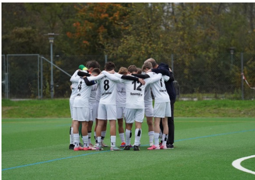
Die U16 des FC Dingolfing zeigte in der Vorrunde eine steile Lernkurve und blickt optimistisch auf die Rückrunde.

Ein besonderer Dank gilt den Spielern der U15, Besian Elmazi und Ömer Coskun, die mehrfach ausgeholfen haben und maßgeblich zum Zusammenhalt beigetragen haben.